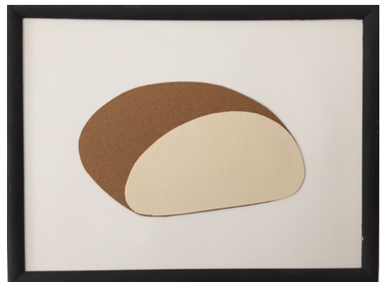
Abb. li: Ulrich Meister, O.T., n.d., Acryl auf Leinwand, 30 x 40 cm

Abb. re: Ulrich Meister, Brot, Papierobjekt, n.d., 15 x 20 cm