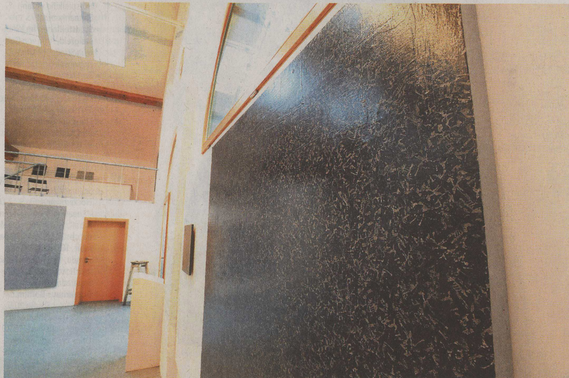
„Schwarz“, 182 mal 178 Zentimeter.