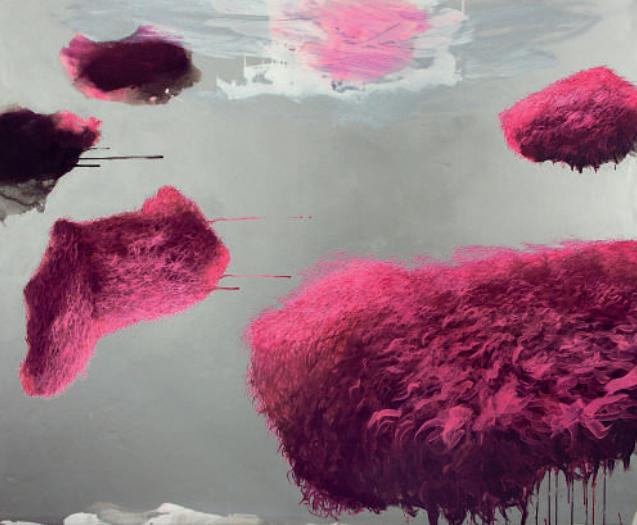
Harald Gnade Malerei