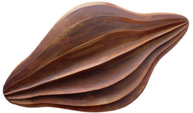
Herbert Mehler Skulptur